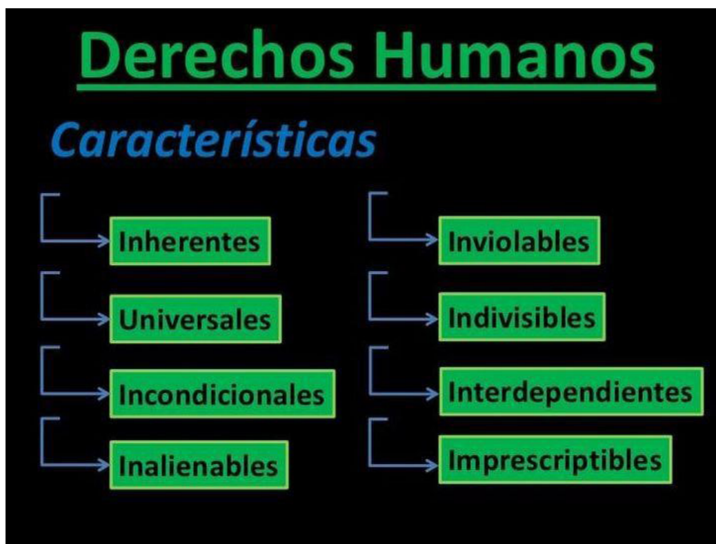
Figura 1. Principales características de los derechos humanos

Características de los derechos humanos. Principales características de los derechos humanos [Internet]. 2015 [citado 10/05/2021]. Disponible en: facebook.com/caracteristicasdelosderechoshumanos/