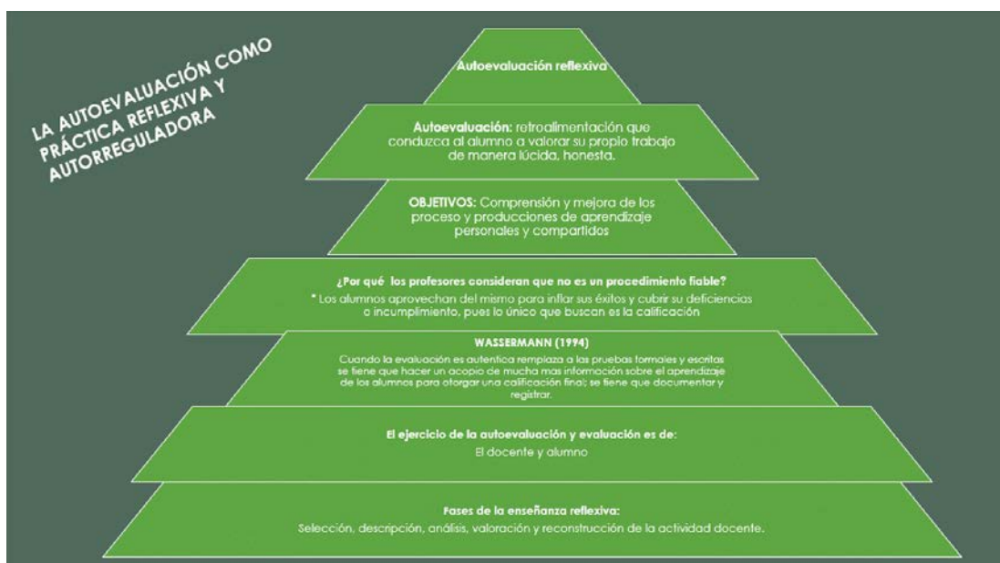
Ilustración 6. Estrategia de Evaluación