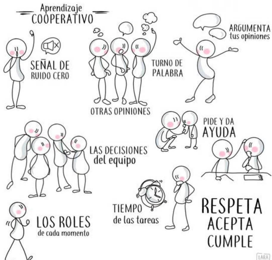
Ilustración 4. Condiciones para el aprendizaje Cooperativo

Hay también una interacción simultánea entre los integrantes del trabajo cooperativo. Deben aprovechar ese espacio y tiempo estipulado para alcanzar las metas propuestas. Y por último se requiere que todos tengan igual participación para el éxito de esta estrategia de aprendizaje. Todos tienen conocimientos y aportes que dar al tema en discusión en igualdad de condiciones.