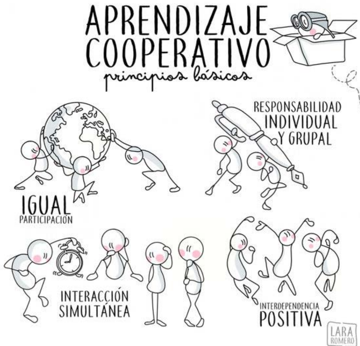
Ilustración 3. Aprendizaje Cooperativo